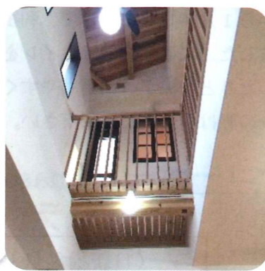
「リビングの大きな吹抜」

限られた敷地の中で、出来るだけ光が入る様にリビングに吹抜を設け、2階からも光を取り入れました。